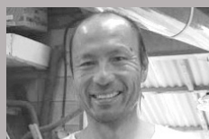
知名工房 知名 進 Susumu China

Committed to using timber from Yanbaru, the studio creates tableware intended to become part of everyday living. Preserving the natural beauty of the wood grain, each piece is distinguished by its unique form and character. Many of the works are used in restaurants throughout Okinawa, while others have been introduced as lounge furnishings in hotels.